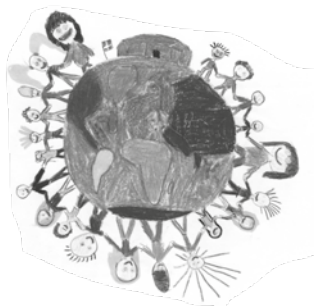
Forsiden er tegnet af Freja Djursaa Fabrin 5. klasse - 2011